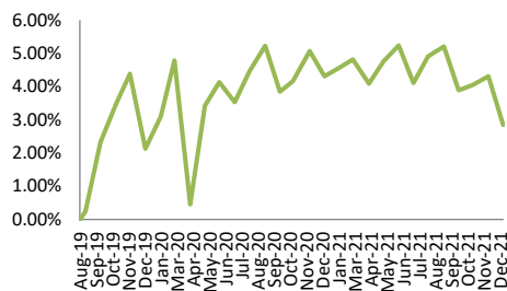
— Proteksi Gebyar 2